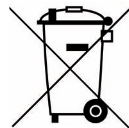
Imagen del símbolo de recogida selectiva

2. En cuanto a los DISTRIBUIDORES , tienen la obligación de recepcionar temporalmente los RAEEs que le sean entregados por el usuario final, por ejemplo, un instalador, cuando adquiera otro aparato de las mismas características.